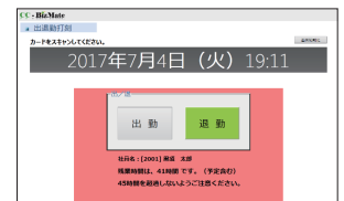
打刻画面警告イメージ

※文中に記載された会社名、商品・製品名、サービス名は各社の登録商標または商標です。