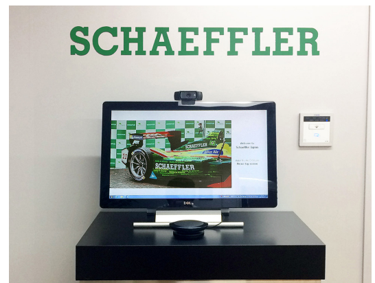
【シェフラー・ジャパン来客・受付システム】

また、受付システムのモニターには、自社がスポンサーとなっている「フォーミュラーE」のマシン映像を流し、デジタルサイネージとして活用しています。興味深い映像を映すことにより、外部からの来訪者の目を楽しませて好評を得ています。