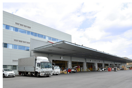
カネサ藤原屋 本社一物流センター

働き方改革への対応と、合わせて本社社屋の移転を契機に勤怠システムの刷新が検討され、複数の候補システムの中からクロスキャットのCC-BizMateが採用されました。給与システムとスムーズに連携できる機能面に加えて、導入コストが低いことが採用の決め手となりました。