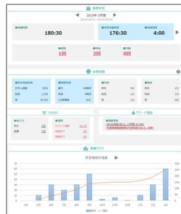
トップページ画面（左：スマートフォン版、右：パソコン版）